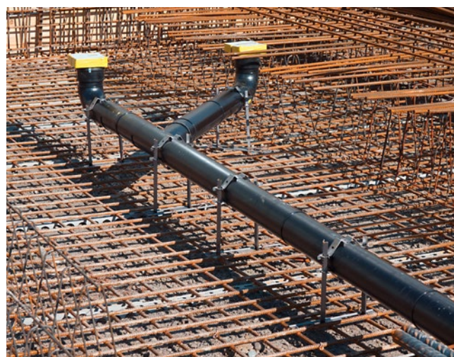
[FIG. 1] Exemple de collier de dalle pour plafond en béton apparent.

Lorsque les plafonds sont en béton apparent, on veillera à utiliser des matériaux de marquage effaçables. Les caissons doivent être cotés et marqués de manière à couvrir les marques. Les systèmes de fixation utilisés ne doivent pas laisser de résidus (clous, aspérités) sur les plafonds en béton apparent.